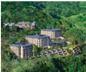
エクシブ箱根離宮様 (神奈川県箱根町)