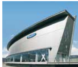
すわかランド様 (長野県諏訪市)

会員制リゾート業界トップを誇る「エクシブ」でおなじみのリゾートトラスト社様が運営する各ホテルにおいて多数の採用実績があります。