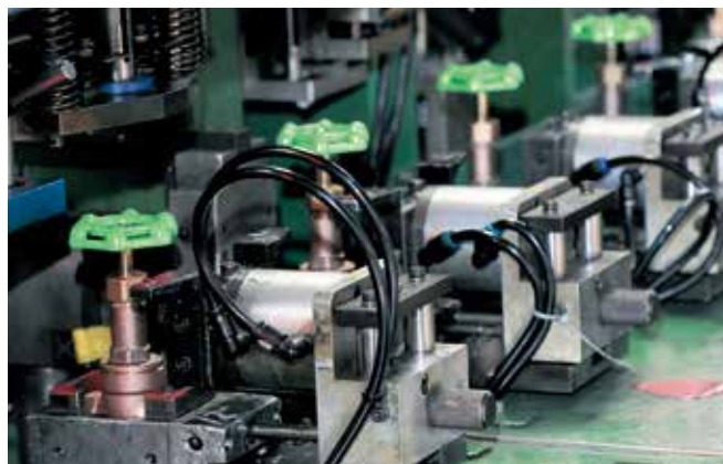
組立ライン Assembly Line