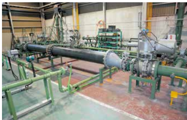
試験設備 Test Facility

Quality assurance constitutes the basis of manufacturing. Toyo Valve implemented its founding policy of quality first when introducing its own evaluation technology in the respective manufacturing stages, in addition to the Quality Control and Inspection departments, thereby ensuring the production of high-quality products under a rigorous quality assurance system. The result is that the Toyo Valve brand has won the confidence of customers. We will continue to endeavor to manufacture products that satisfy customers in terms of quality, delivery time, and cost as well with the Customer First policy in mind.