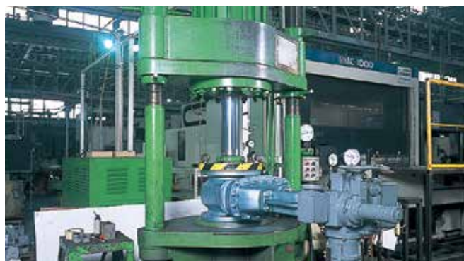
圧力検査 Pressure Test