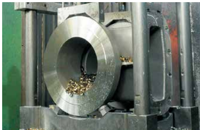
切削工程 Cutting Process

Toyo Valve's diverse and innovative products result from an integrated production system backed by outstanding technical capabilities and extensive expertise in casting, processing, assembling, inspection, and shipping at the factories of Kitz Group. Each manufacturing process is streamlined in pursuit of enhanced quality and productivity, thereby establishing a system to manufacture consistently high-quality products for rapid delivery.