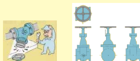
製品CAD姿図データ(DXF)イメージ