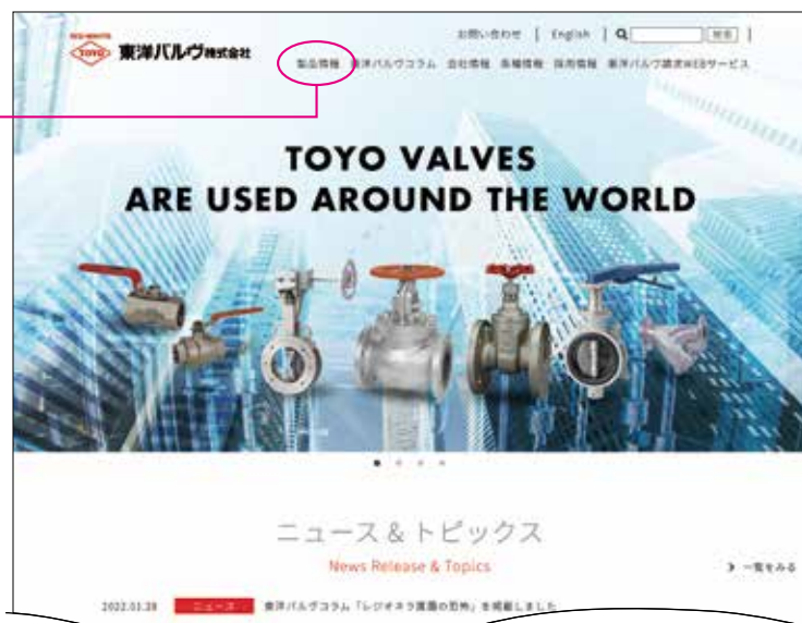
ホームページ ヘッドページ