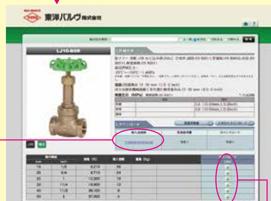
製品・図面・CADデータ検索例