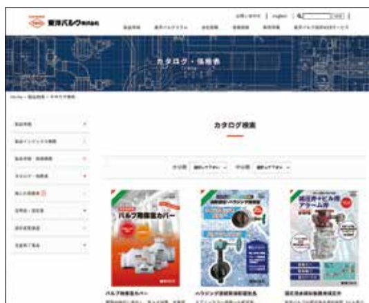
製品カタログ検索例